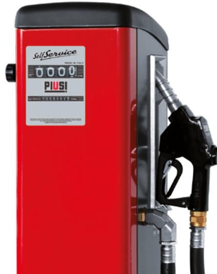
MEDIDOR MECÁNICO INTEGRADO