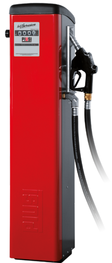
SELF SERVICE K44