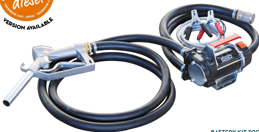
BATTERY KIT 3000