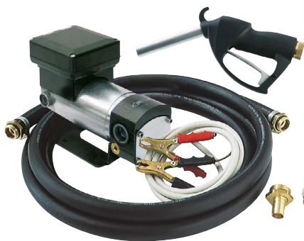
BATTERY KIT OIL