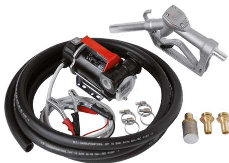
BATTERY KIT 3000 INLINE