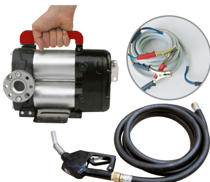
BATTERY KIT BIPUMP

BIO ANY BIODIESEL A AIRE AdBlue® ANTICONGELANTE AdBlue® B BIODIESEL D DIÉSEL F ALIMENTOS G GASOLINA G GRASA K QUEROSENO O ACEITE W AGUA W LIMPIAPARABRISAS