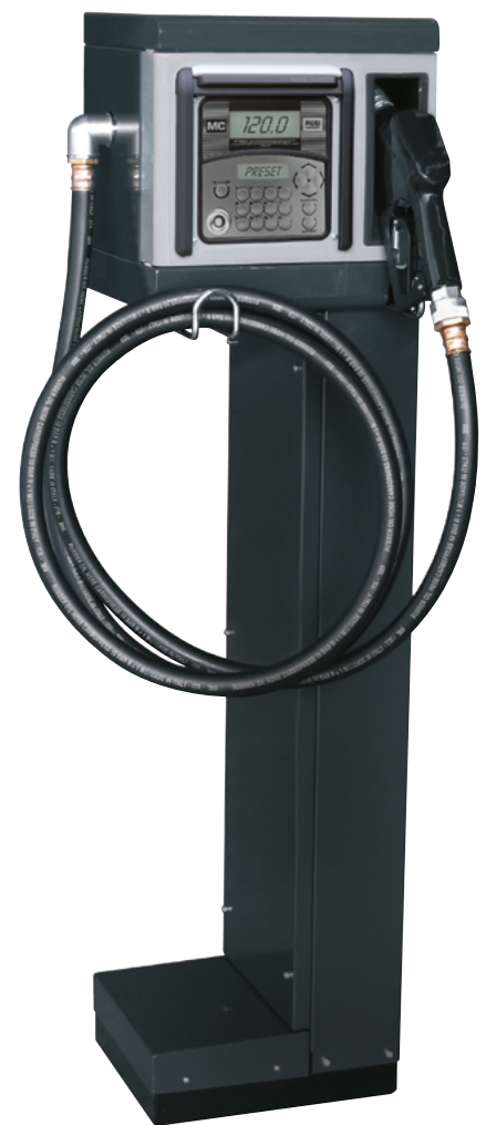
CUBE 70 MC CON PEDESTAL (OPTIONAL)