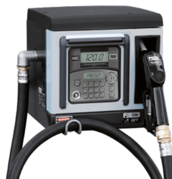
CUBE 70 MC