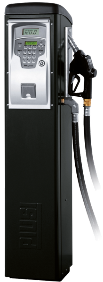
SELF SERVICE FM 2.0