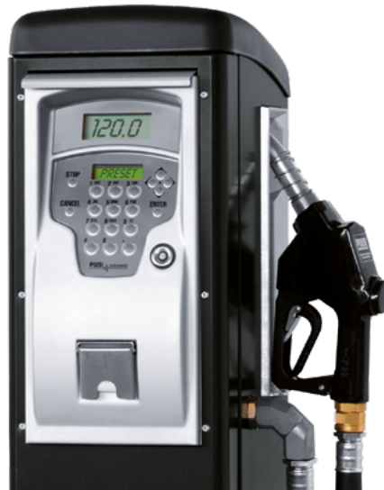
INTEGRADO TICKET PRINTER