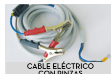
CABLE ELÉCTRICO CON PINZAS