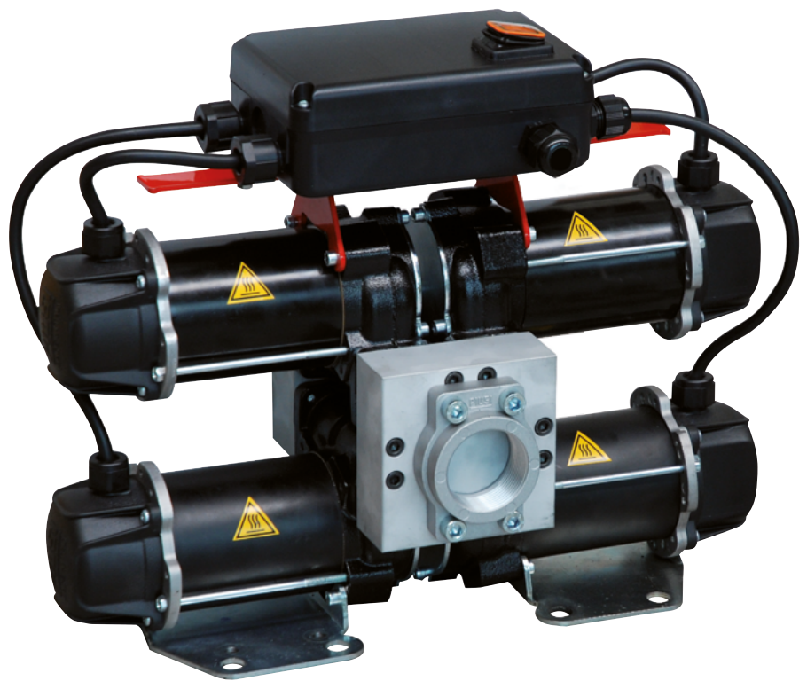
ST 200 DC